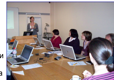
Университета в Устър представя ресурса

„Мисля, че тази информация ще ми бъде полезна в работата ми с хора с обучителни трудности.“